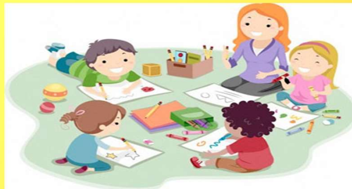
Scuola statale dell'Infanzia di Cuasso al Monte